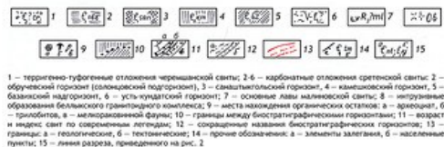
Рис. 1 — Карта местонахождений окаменелостей Казырского опорного разреза; Рис. 2 — Разрез нижних слоёв и стратиграфическая колонка сретенской свиты