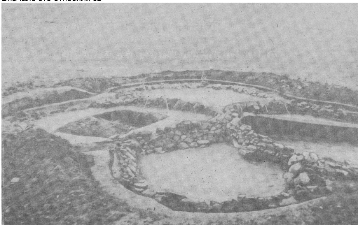
Рис. 5. Андроновский могильник Ланин Лог, к. 1. Раскопки С. А. Рахимова (1964 г.).

В целом работы произведены в 36 пунктах, на 6 поселениях и 30 могильниках. Ограды могил чаще разрушены, поэтому их раскопанное количество (174) не отражает всего объёма работ. В общей сложности раскопано около 370 могил, включая детские. Почти полностью раскопаны могильники Орак I, Новая Чёрная II и более чем наполовину Сухое Озеро I. Памятники найдены в Назаровской, Чулымо-Енисейской и Сыда-Ербинской котловинах и практически полностью не известны в собственно Минусинской котловине. Вначале это относили за