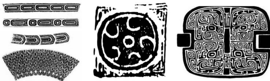
Ил. 1. Геометрические орнаменты