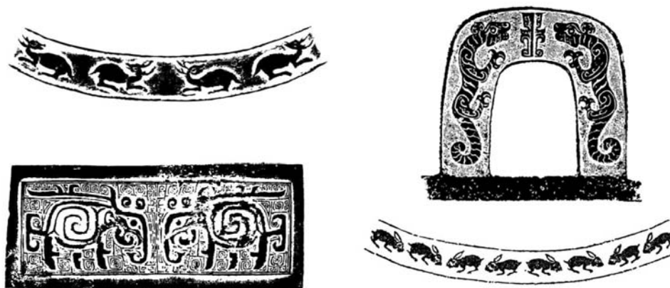
Ил. 6. Орнаменты оленя, тигра, слона, кролика