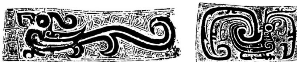
Ил. 4. Орнамент птицы-феникса

Орнамент птицы очень часто встречается у торговцев бронзовыми изделиями Западных Чжоу, и достиг своего пика популярности в середине