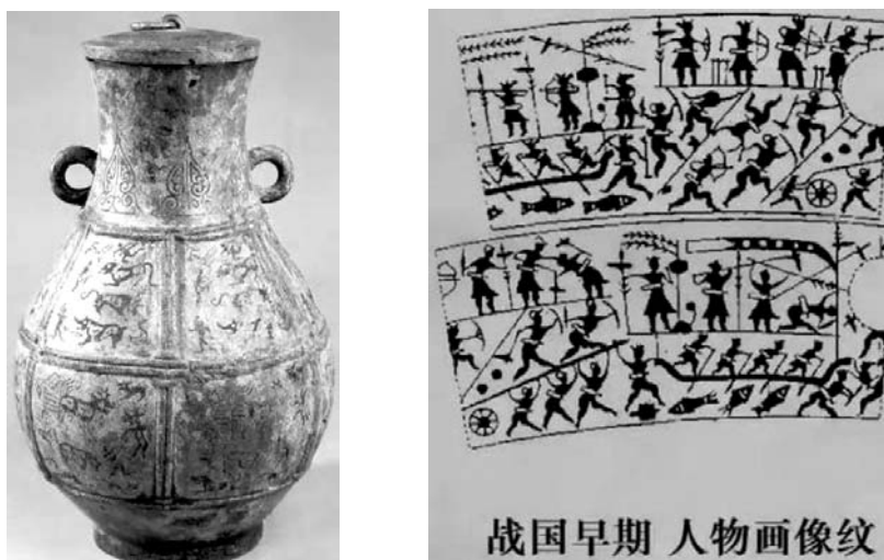
Ил. 8. Орнаменты человека и фона