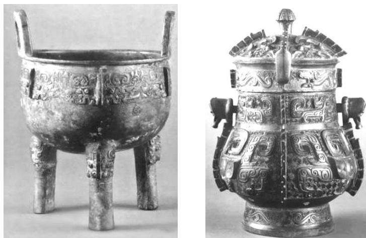
Ил. 2. Орнамент Таоте

Таоте (饕餮) — загадочный монстр в древнекитайской мифологии. Есть много версий о происхождении Таоте. В одной из них он называется сыном Цзинь Юнь Ши (缙云氏) или драконом. Друге говорят, что Таоте — это один из четырех жестоких монстров в древние времена. И есть также мнение, что Таоте — это тигр деформации. Неважно, какого рода утверж-