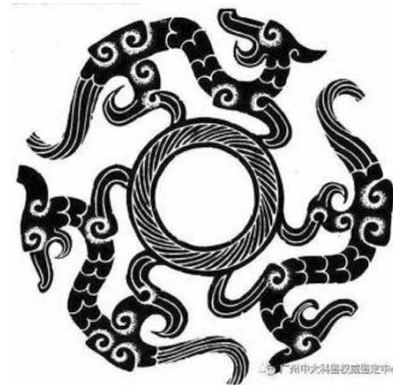
Ил. 3. Орнамент дракона