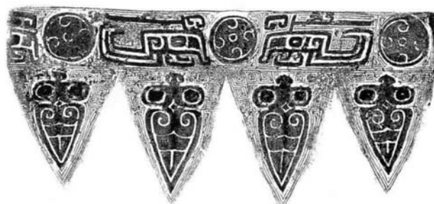
Ил. 7. Орнаменты цикады

Шан, этот орнамент обычно появлялся на Дин (鼎 четырехножник DING), Цзюэ (爵 JUE) и небольшом количестве тарелок. Это связано с диетой и умывальной, что символизирует чистую диету. Кроме того, цикады живут на земле в течение нескольких или даже десяти лет, прежде чем отрастить свои крылья, они поднимаются на дерево, линяют, а уже после отращивают крылья и взлетают в воздух, чтобы завершить цикл жизни. Поэтому орнамент «цикады» также символизирует воскрешение из мертвых и лелеет добрые пожелания создателей.