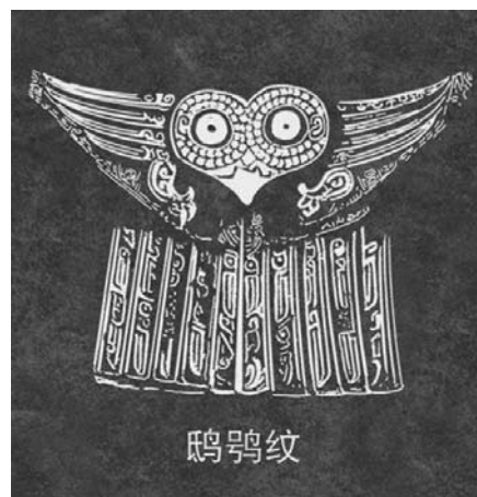
Ил. 5. Орнамент совы (найден в Гробнице Вухао)

правления Западной династии Чжоу. Наиболее очевидной особенностью орнамента птицы является то, что клюв изогнут в форме крючка с рогом на голове, длинным, свисающим или рассеянным хвостом. Часть орнамента приукрашивали, изображая рассеянные перья на хвосте птицы.