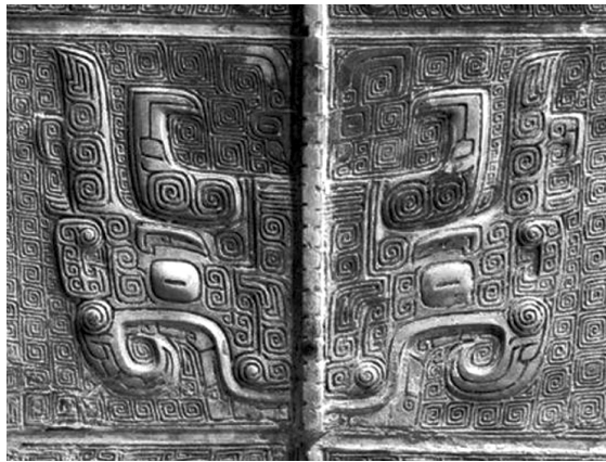
Ил. 2. Вариант орнамента Таоте

Три основные части орнамента Таоте: глаза, рога, тело. При этом глаза и два рога являются наиболее разнообразными и в то же время наиболее очевидными деталями орнамента Таоте.