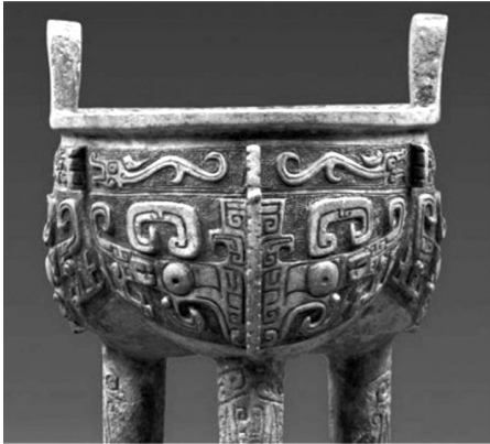
Ил. 1. Бронзовый сосуд с изображением маски Таоте, где сам сосуд, возможно, представляет тело, а ножки — ноги Таоте

Другие ученые предлагают иные наименования подобных орнаментов. Например, Цю Жуйчжун называет его «трехмерным орнаментом головы дракона» [8], а Чэнь Мэнцзя — «орнаментом бычья голова» [9] и т. д. Но эти наименования не используются так широко, как «орнамент маски животного».