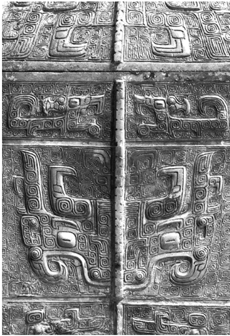
Ил. 4. Орнамент Таоте с двойными рогами

нались благоговением перед потусторонним и величественным украшением и в то же время перед его обладателями, которые именно этого и добивались.