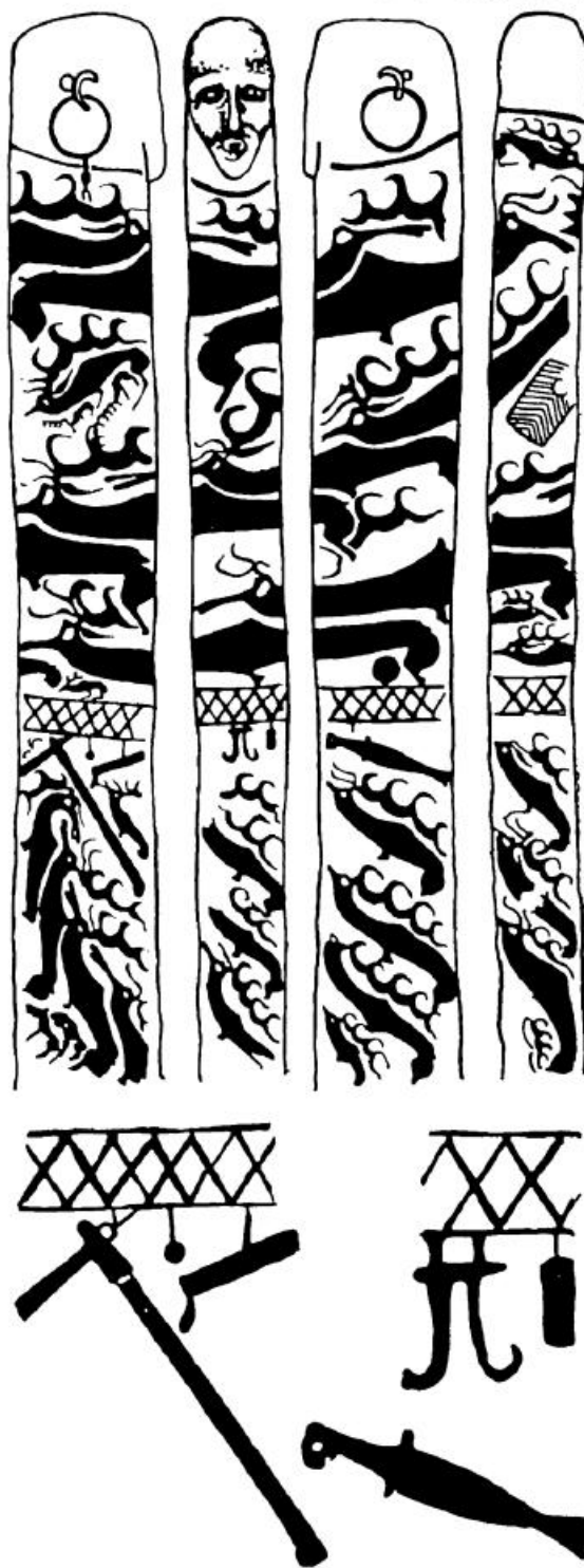
Рис. 3. Олений камень 14.

Камень 12 лежал в земле, в 9 м от камня 11. Стела эта с обломанной верхней ча-